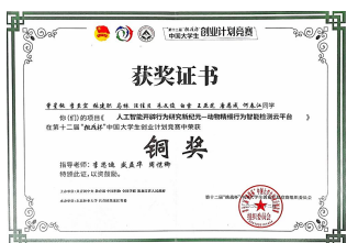
2020 全国第十二届挑战杯铜奖