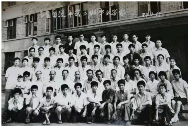
图为 1982 年中药班毕业合影

药学专业最早源于 1972 年吉首卫校开设的中药学专业，1983 年开设药学大专班。2016 年经由湖南省卫生计生委、湖南省教育厅批准正式招生的四年制本科专业，2020 年通过药学本科专业评估,同年获批湖南省一流专业。该专业的“药理学”课程入选湖南省“一流课程”，“药学类专业创新创业教育中心”成功入选湖南省高校创新创业教育中心。