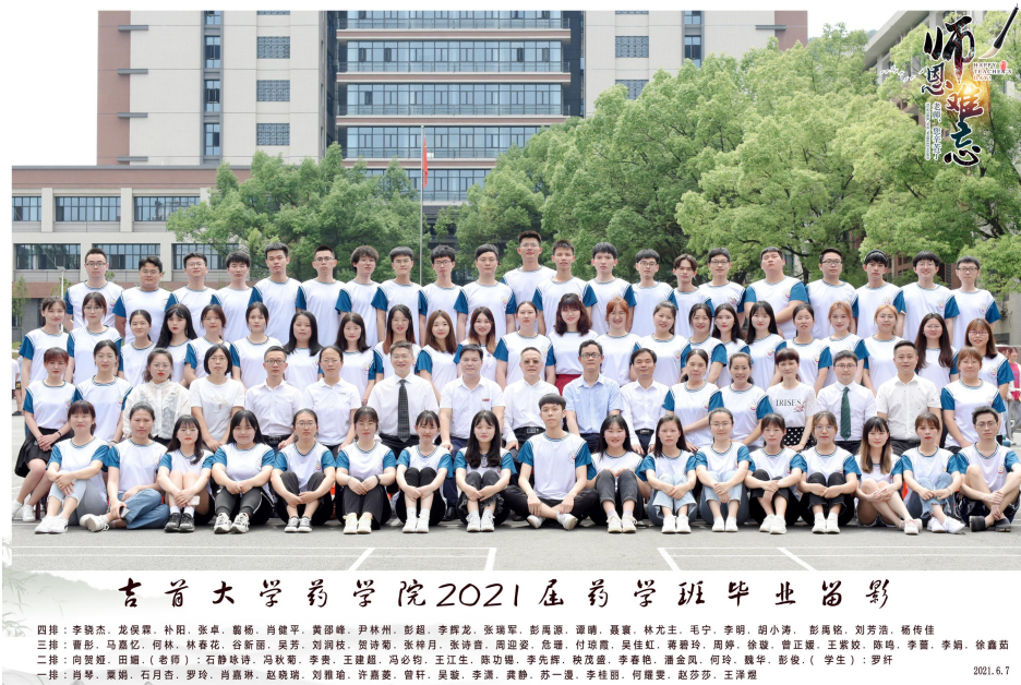
吉首大学药学院2021届药学班毕业留影

药学专业成为新时代的热门专业。现如今医药产业已成为世界经济强国竞争的焦点，中国医药企业发展迅猛医药事业进入发展的风口期，但是我国的医药产业人才却很紧缺，市场对药学专业人才有非常大的需求。从当前医药行业反馈的信息来看，人才供不应求，优秀医药人才炙手可热。吉首大学药学院狠抓高质量培养和高质量就业，探索实施“实习就业融合模式”，得到广大企业的大力支持，学生在实习期享受 2000-4000 元/月的薪酬待遇，转正后的平均薪酬在 6000 元-14000 元左右，学院毕业生可以 100% 高质量就业，就业前景非常好。从专业对口程度来说，我院大部分学生从事与“药”有关的工作。