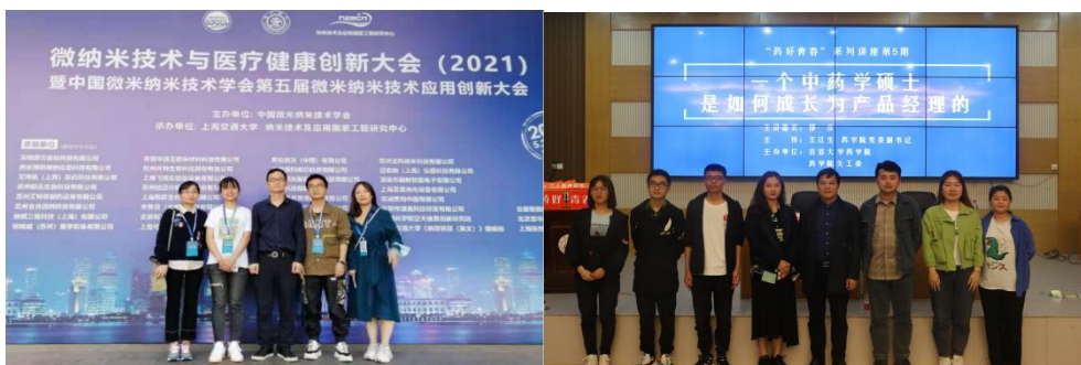
师生参加全国学术会议

本专业教师 2016-2020 年共主持各级科研项目 37 项,其中国家自然科学基金 11 项,教改项目 8 项,科研总经费 570 多万元;发表代表性论文 71 篇,其中教改论文 16 篇、SCI/EI 收录学术论文 19 篇、其他核心期刊学术论文 36 篇,3 年人均公开发表论文数为 2.22 篇;出版专著 5 部、省级重点教材 1 部,授权发明专利 6 项;获湖南省自然科学三等奖 1 项、技术发明三等奖 1 项、国家民委教学成果二等奖 1 项。