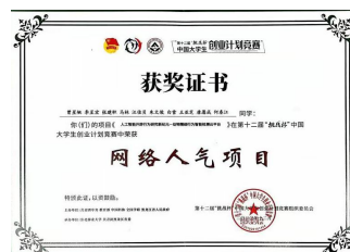
2020 全国创业计划竞赛网络人气项目