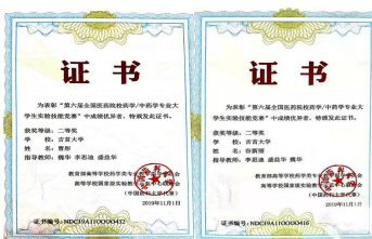
2019 全国医药技能大赛二等奖