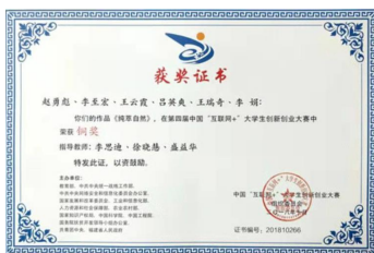
2018 全国创新创业大赛铜奖