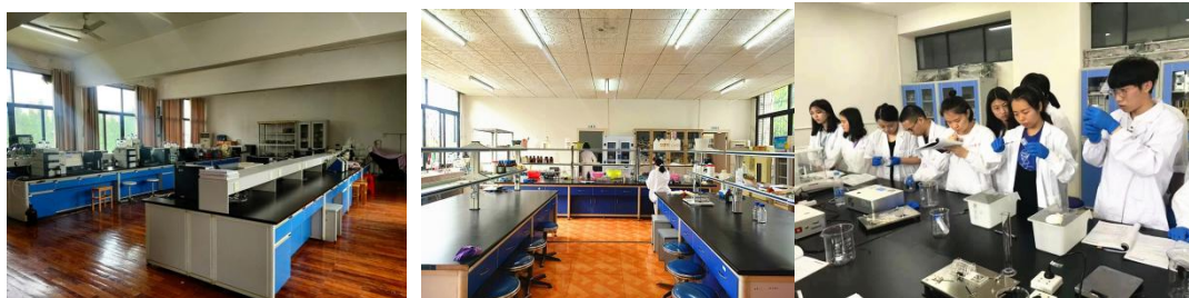
图为 宽敞整洁的实验室

理学实验室、药物分析实验室、人体解剖生理学实验室、微生物与免疫学实验室、生药学实验室等,即将投入使用的实验室用房 5000 余平方米。拥有主要仪器设备 507 台套,总价值 988.2 万元。