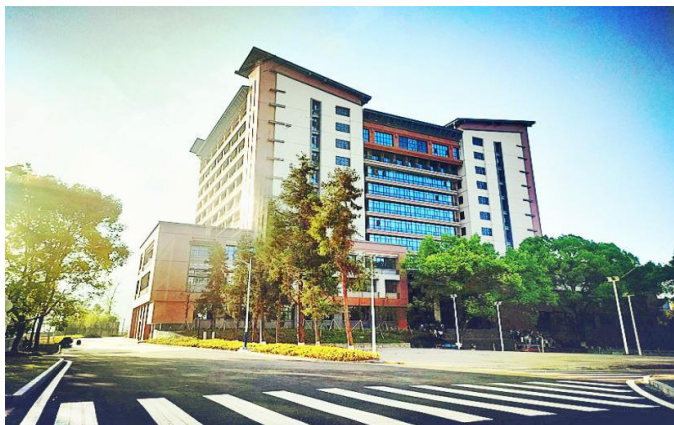
图为 现代化医药实验大楼

药学专业现有在籍学生近 300 人，具有“生物与医药”硕士专业学位点，参与“生物学”、“临床医学”硕士学位点以及“生态学”一级学科博士点学科建设。本专业坚持校企合作、协同育人机制，以学生专业实践能力培养为主线，强化实践教学环节，分别设置了实验课、专业见习、专业竞赛、社会实践、毕业实习和毕业论文（设计）等实践教学环节。主要课程有生物化学与分子生物学、微生物学与免疫学、药学导论、药物化学、生药学、药理学、药代动力学、药物毒理学、药物分析、药剂学、生物技术制药、天然药物化学、药用资源学等。旨在培养具备国际视野、科学素养、创新能力和人文精神，掌握扎实的药学学科基础理论、专业技能，具备药品生产、药物分析与质量控制、临床合理用药等专业知识以及继续深造攻读硕士、博士研究生的潜力，能在医药院校、药房、企业、药品检验和管理等部门从事药物研发、药品质量控制、药物生产和销售、药事管理工作的高级医药人才。