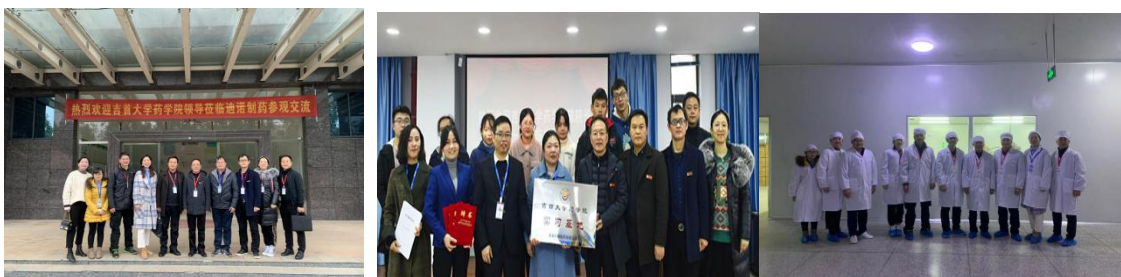
图为 与企业开展深度合作

目前,药学专业专任教师 18 名,专任教师中教授 6 名(二级教授 1 人、三级教授 1 人)、副教授 4 人、讲师 8 人,高职称教师占比 55.56%;博士 10 人,在读博士 2 人,占比 66.67%(绝大多数为国家顶级科研机构或一流大学);45 岁以下教师 7 人,占 38.89%,50 岁以上教师 7 人,占 38.89%。教师队伍中有博士生导师 1 人、硕士生导师 6 人,湖南省新世纪“121”人才工程和芙蓉学者奖励计划人才 4 人、湖南省青年骨干教师 5 人、全国“挑战杯”大赛一二等奖指导老师 2 人、全国大学生“互联网+”优秀指导老师 2 人,获校级以上“教学名师、优秀共产党员、优秀班主任”等荣誉称号的 10 余人次;担任国际 SCI 期刊副主编 1 人,中国民族医药学会、中国植物学会、中国生物工程学会、中国生态学会、中国民族医药协会等国家级学会理事、专业委员会委员等 14 人次。